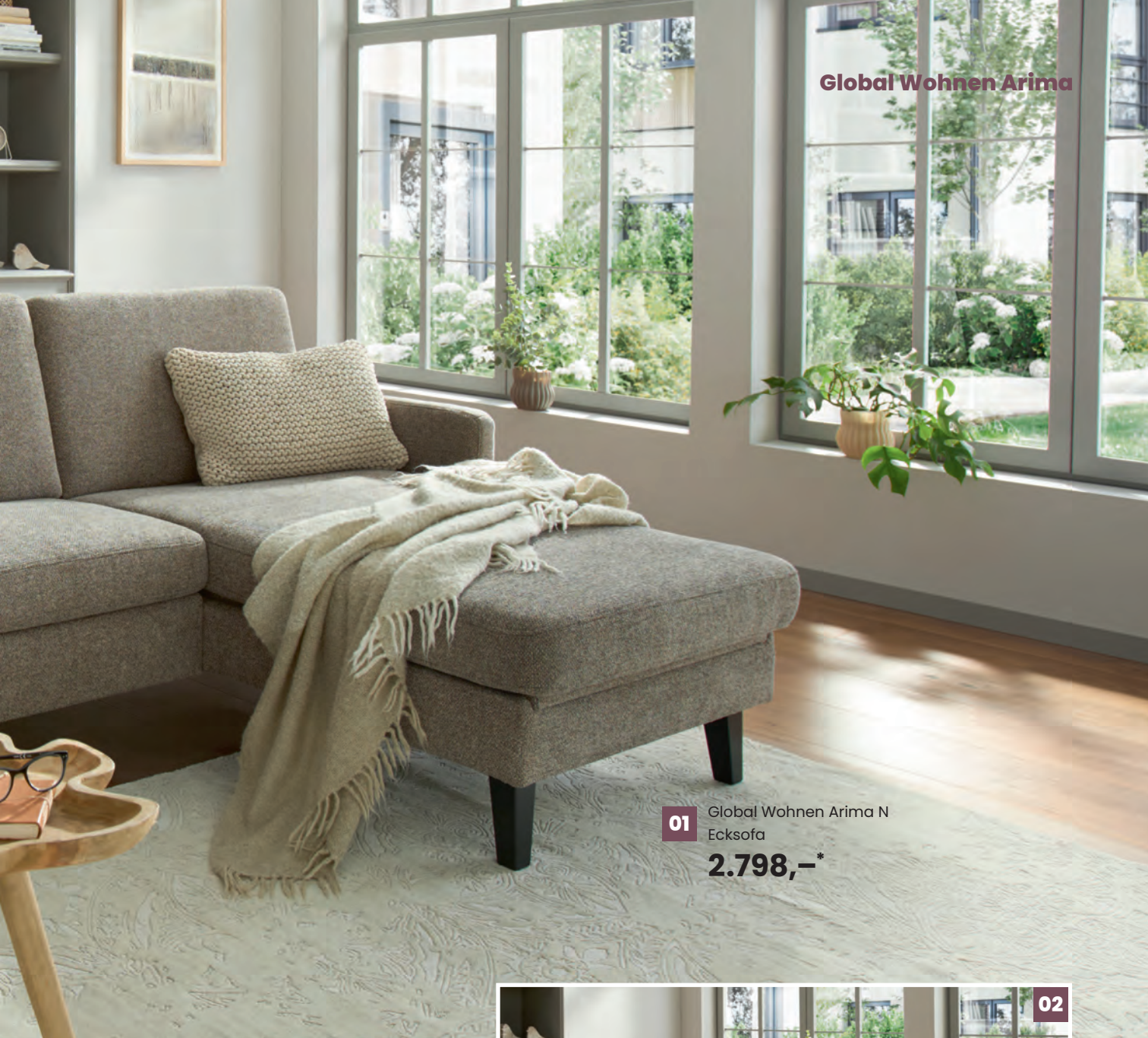
01 Global Wohnen Arima N Ecksofa 2.798,-*

01 Global Wohnen Arima N Ecksofa in Stoff Catania mode, 100% Polyester, Holzfuß schwarz, inkl. Armlehnen klappbar, BHT ca. 266 × 88 × 164 cm, 2.798,-*