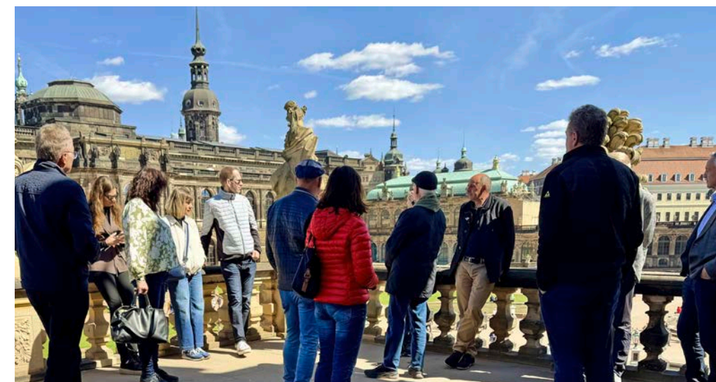
Barock-Rundgang bei strahlendem Wetter durch Dresden für alle, die bereits am Sonntag angereist waren.

tum im Mittelstand. Nun geht es für uns darum, diese Stärken gemeinsam in die digitale Welt zu übertragen. Dazu gehört auch ein deutlich intensiveres Community-Management durch unser Vertriebsteam, das die Unternehmerinnen und Unternehmen vor Ort unterstützt in den Bereichen KI und Change-Management. Es ist unser absolutes Ziel, jeden unserer Gesellschafter fit für die Zukunft zu machen.“ Auch in anderen Bereichen entwickelt sich der Verband weiter und investiert in wichtige Projekte, die die Zukunftsfähigkeit sichern. „Einkauf, Logistik und Produktmanagement werden weiter professionalisiert, um das